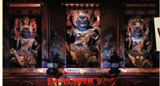
金峯山寺秘仏本尊 金剛蔵王大権現 恐ろしい形相で体を青に燃やす権現様3体は、釈迦如来(過去)、観音菩薩(現在)、弥勒菩薩(未来)が今の乱世にふさわしい強い姿として権(仮)に現れた「アンダー」体。体の青い色は、慈悲や清らかさを象徴している。

桜色に包まれた春もいいが、初夏の「青の吉野」も魅力的だ。新緑の吉野山から清涼の宮滝へ、森林浴ウオーク! まずは、蔵王堂で青の権現様に挨拶を。旅館や土産物店が並ぶ通りを抜け、杉がひしめく山道を進もう。抜けるような青空とせせらぎの音に癒やされながら古の道を下った先は、宮滝。エメラルド色に輝く渓谷美に、万葉人がこの地を愛したのもうなすける。