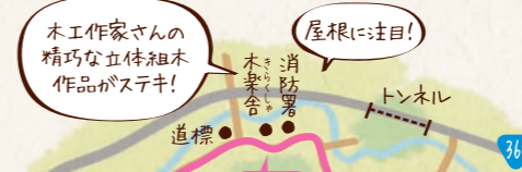
木工作家さんの精巧な立体組木作品がステキ!