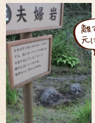
離すと泣き、元に戻るとか