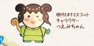
御杖村マスコットキャラクター「つえみちちゃん」

walking map ● 歩行距離 約14km ● 歩行時間 約6時間 ※地図内の時間表記は前地点からの到着時間