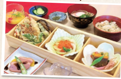
食事処「山桜」の人気メニュー「倭姫膳」1,300円