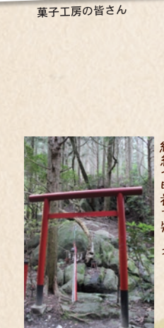
倭姫命が婦人病の回復を祈ったと伝わる、安産女性病縁結び明神で知られる