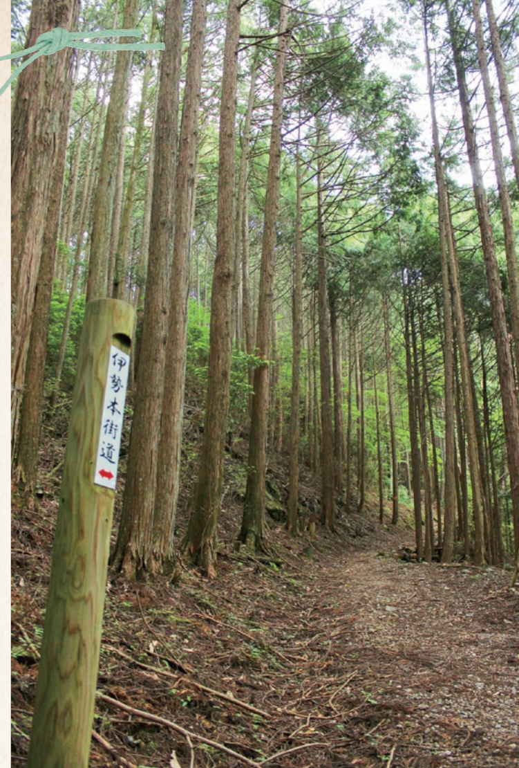
鞍取峠/峠越えの途中、急坂のため馬の鞍(くら)が飛んだ「鞍飛び」から「鞍取」になったと伝わる

PART.39 うおーきんく Walking 2014.8 御杖村を西から東へ大横断 峠越えを楽しみつつ 伊勢本街道本気ウォーク! 今月は、奈良県最東部の御杖村を通る伊勢本街道をひたすら歩く。かつて街道屈指の難所だった鞍取峠を越えるものの、今では歩きやすい山道に心も足取りも軽やか♪ 村の西側が大和領、東側が伊勢領だった時代の名残で、地区によって違う表情の街道歩きを楽しみ、苔むした岩が出迎える岩坂峠を経た後は、道の駅「伊勢本街道御杖」の姫石の湯へ。