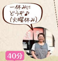
一休みにどうぞ（火曜休み）