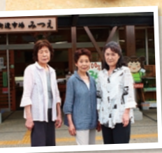
菓子工房の皆さん