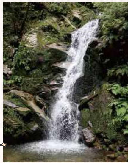
落差約10メートル。「やまとの水」の源、佐保川の源流