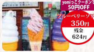
yomiっごクーポンで50円OFF ブルーベリーソフト 350円 残金 624円