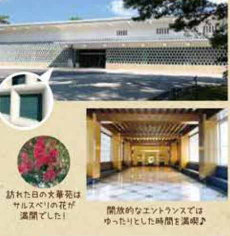
●特別展(予定) 10/9(土)~11/14(日)「天之美祿 酒の美術」

【MENU】 ●メロンパン 140円 ●塩パン 108円 ●明太フランス 216円 など