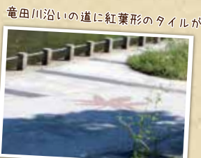
竜田川沿いの道に紅葉形のタイルが