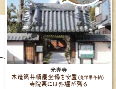
光専寺 木造筒井順慶坐像を安置(見学要予約) 寺院裏には外堀が残る