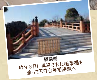
極楽橋 昨年3月に再建された極楽橋を渡って天守台展望施設へ

【第61回 大和郡山お城まつり】 ● 3/24(木)~4/7(木) 夜桜ライトアップ 18:00~20:00 ※時代行列、露店、パーク&バスライド、一部イベントは中止 ※期間中の宴会は禁止