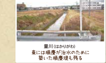
量川(はかりがわ) 東には順慶が治水のために築いた順慶堤も残る