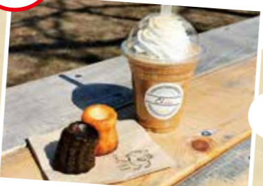
三の丸緑地のベンチで休憩!