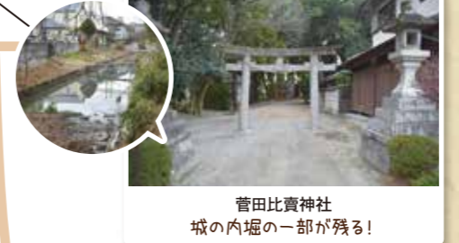
菅田比賣神社 城の内堀の一部が残る!