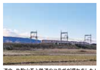
道中、生駒山系と鉄道のコラボが撮れました!

筒井城跡から柳町商店街までの道を割愛しましたが、一本道で迷わないのでご安心を。道中、神社や地蔵などがいくつかあったのですが残念ながら詳細不明。歩いてみると疑問や発見がたくさん出てくるのが旧街道歩き醍醐味ですね。今度はどこを歩こうかな!