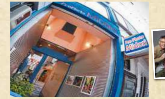
記念撮影(七五三)サンプルカット

春日大社より婚礼撮影指定を受ける大正13年創業の4代続く老舗写真館。アットホームな店の雰囲気でもらうと立ち寄る感覚で撮影が可能。記念撮影以外にも各種証明写真・就活用写真といった普段使いもできる。 住 奈良市東向北町8 0742-22-6309 時 10:30~18:00 休 不定休 P 近隣に有料Pあり