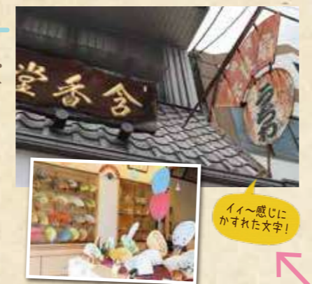
イー感じにかすれた文字！

創業170余年(江戸後期)6代続く日本で唯一の奈良團扇専門店。材料や道具を含め、全13の工程を家内工業により手作りで仕上げる。 ★奈良團扇作り体験・見学あり！（1週間前予約） 住 奈良市角振町16 0742-22-3690 時 9:00~18:00 休 無休（9~3月は月曜）