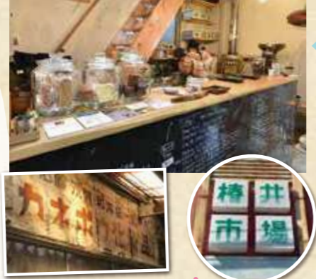
市場奥に廃屋の看板

レトロな市場の中で異彩を放つコーヒースタンド。焙煎暦16年の店主が厳選した豆を全てハンドピック、幅広い年齢層の好みに応える。 住 奈良市橋井町5 橋井市場内 0742-93-6133 時 11:00~18:00 休 水曜、第1・3日曜 MENU・ホット400円〜・コーヒー豆 50g 350円〜