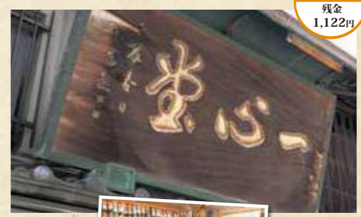
お気に入りの筆を発見！

明治末期に創業して百年余りの奈良墨、奈良筆をはじめとする書道具専門店。伝統製法で作られた墨、筆を書を楽しむ全ての人へ「一心」を込めて贈る。 住 奈良市上三条町3-9 0742-23-2381 時 9:30~18:00 休 月曜