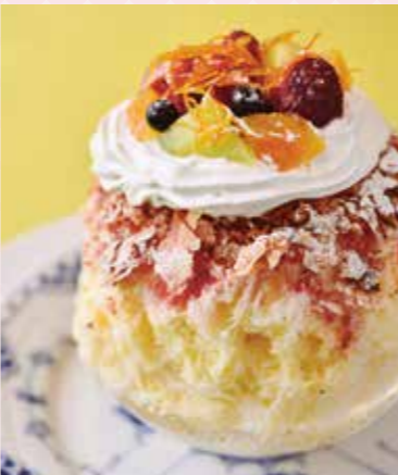
まさにデセールなかき氷は、『フルーツミルフィーユ』(1,200円)ほか2種の月替わりも。