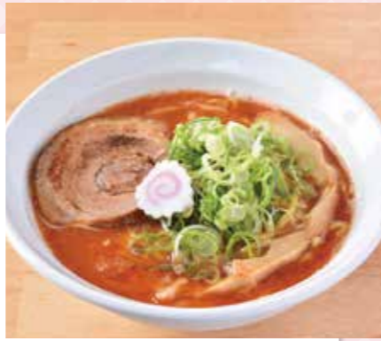
海老そば(塩)。スープの赤色は甘エビの色。辛そうに見えるが、全然辛くない