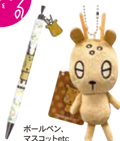
ボールペン、 マスコットetc