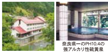
奈良県一のPH10.4の強アルカリ性硫黄泉