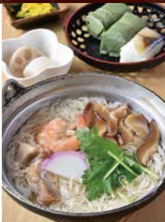
元祖にゆうめん定食 1,080円