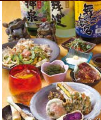
海ぶどう 680円、シーマミー豆腐 580円、 海らっきょ 600円、ゴーヤチャンプル 780円、 野菜の天ぷら 650円、軟骨ソーキのやわらか煮 720円ほか

●座席表記について カ…カウンター席数 テ…テーブル席数 座…座席数 掘…掘りごたつ席数 個室…部屋数 (収容人数) ●メニュー表記について…表記がない場合も「先付」には別途料金が必要です